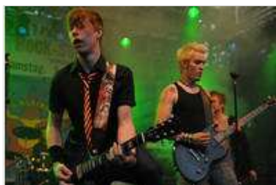
Die Punkrockband "5 kleine Jägermeister" erwies sich als starke Tribute-Band der "Toten Hosen".

Iserlohn. Zur regelrechten Zitterpartie für die Fans und Thomas Herr als Rocksommer-Organisator geriet das ultimative „Hosen-Ärzte-Spektakel“ am Samstag in Barendorf wegen der unkalkulierbaren Wetterkapriolen und der zeitweise sintflutartigen Regenfälle ab Abend.